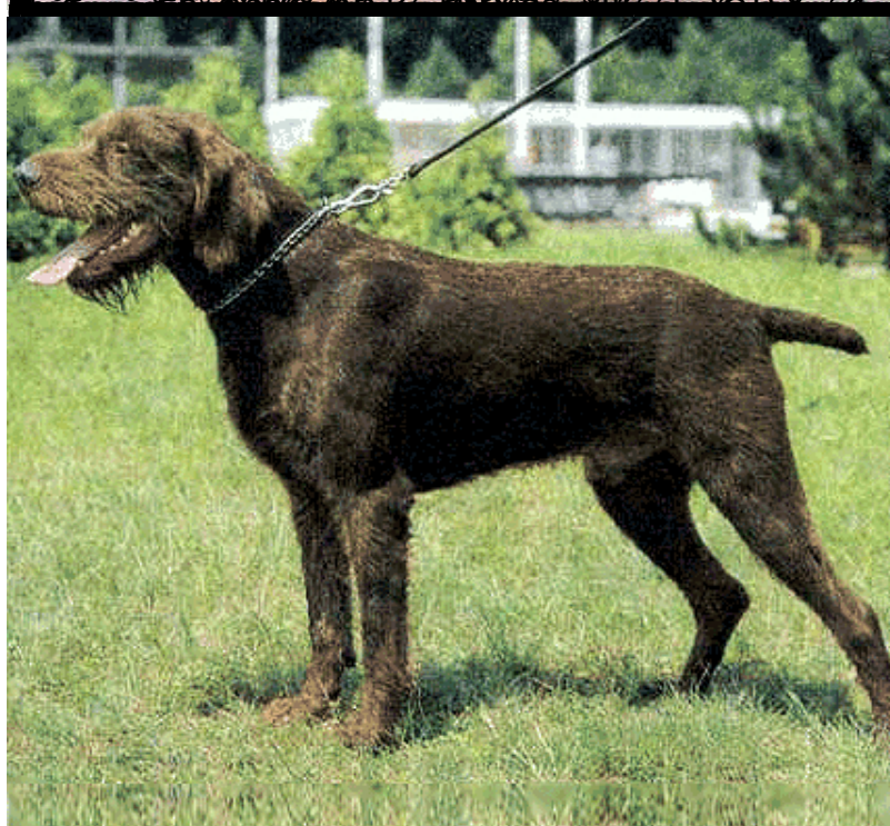
Ветеринарный журнал прикладных FCI